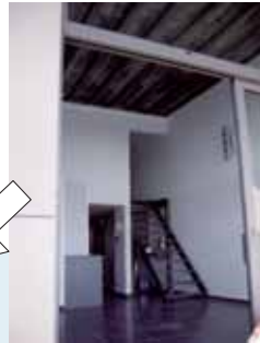
上に広がる伸びやかな空間