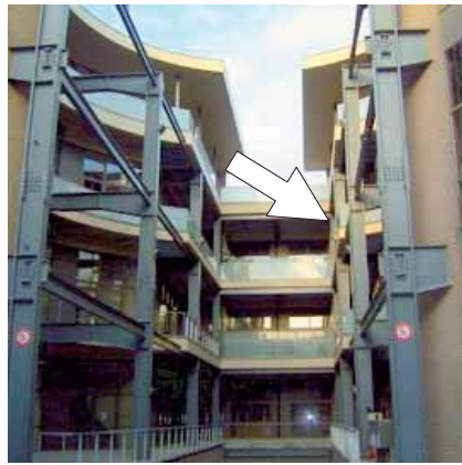
全体の中の彼のマンションの位置