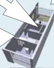
マンションの構造を俯瞰したイメージ (中央がメゾネットになっている)