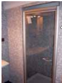
洗面・バス・トイレ等