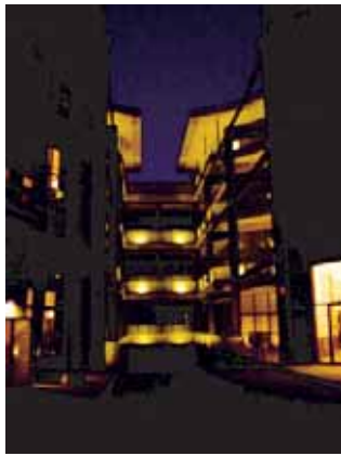
マンションの夜景